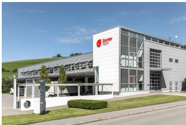
Otto Ganter 有限公司在德国富特瓦根的总部。

Elesa+Ganter 机械配件对于工程师和设计师而言都至关重要，并且被广泛应用于众多行业——从机械工程、自动化、电子工程到医疗设备、包装、食品和制药生产等等。