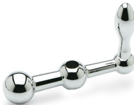
GN 10 三球手柄

在 Elesa+Ganter 公司，传统的机械工艺与现代技术及生产方法相得益彰。公司不断拓展产品种类，同时很少停止现有产品的生产——这让客户能够确信，即使是长期使用的部件在未来也将持续供应多年。一个令人印象深刻的例子是：1912 年 Ganter 公司的第一本目录中就已经出现了 GN 10，这是一种三球手柄（德语：Kugelkurbel）。如今，这一部件仍以同样的名称出售，只是外观略有变化。