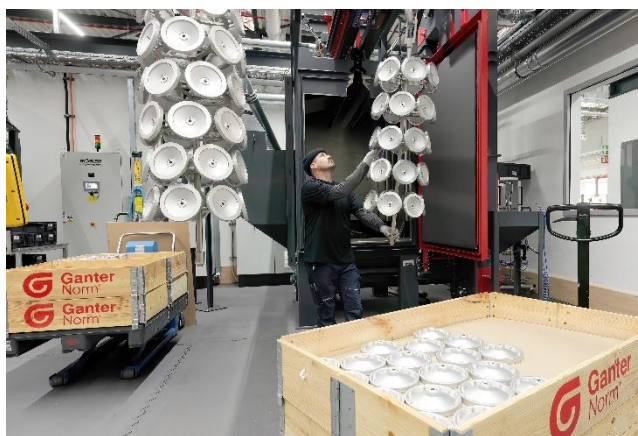
现代化生产与物流。

从那里，我们经过了物流和装配区域，在这些区域，较小批量的产品仍采用人工处理方式，而大批量订单则通过全自动化流程进行处理。最后的生产步骤是表面处理：在公司大型的粉末喷涂设施中，会根据客户要求进行涂装。虽然从技术上讲可以有各种各样的颜色选择，但黑色至今仍是最受欢迎的——在许多部件被包装并运往世界各地之前，它赋予了这些部件独特的外观。